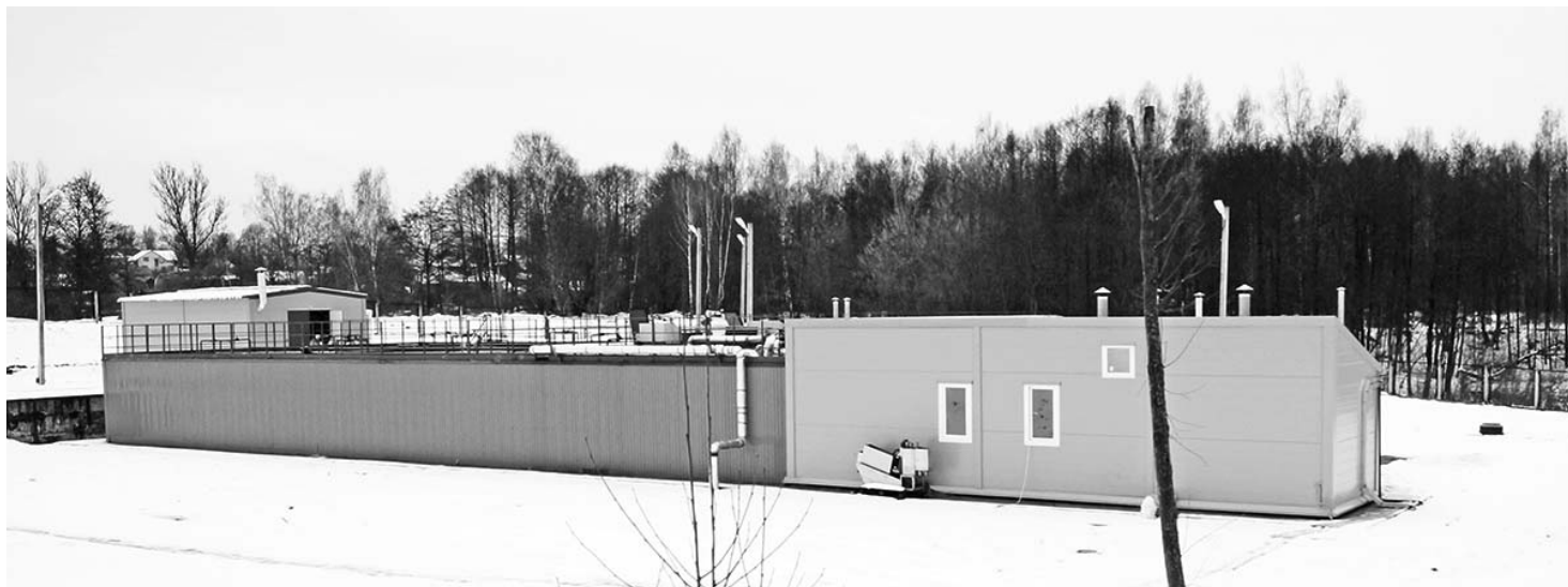
Новые очистные сооружения канализации, п.Думиничи.

* В рамках национального проекта «Успех каждого ребенка. Создание в общеобразовательных организациях, расположенных в сельской местности и малых городах, условий для занятий физической культурой и спортом» в МКОУ «Паликская СОШ № 2» отремонтирован спортивный зал.